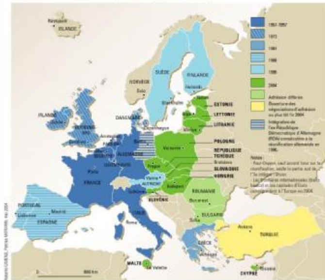
La construction européenne (1951-2004)

Source : http://www.sciences-po.fr/cartographie/cartes/europe/ue/processus/europe2004.jpg