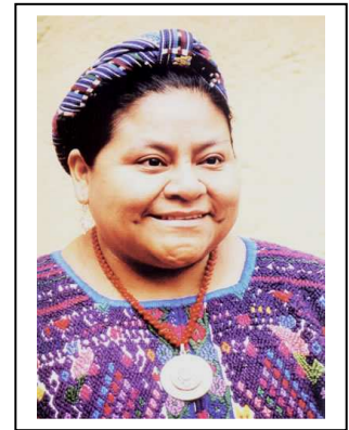
Rigoberta Menchu Tum