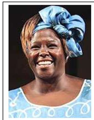
Wangari Muta Maathai